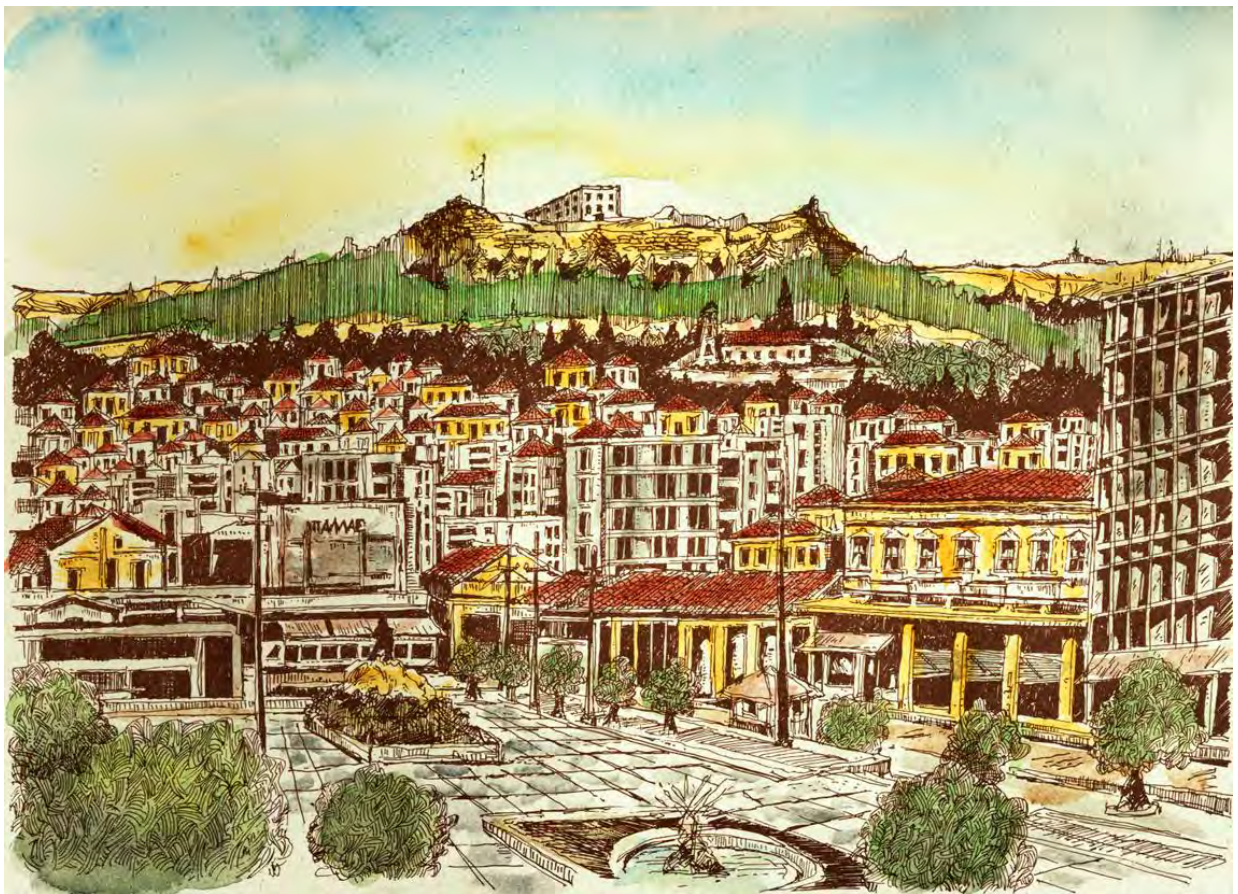
Η παλιά Λαμία (Δ. Κολτσίδας)